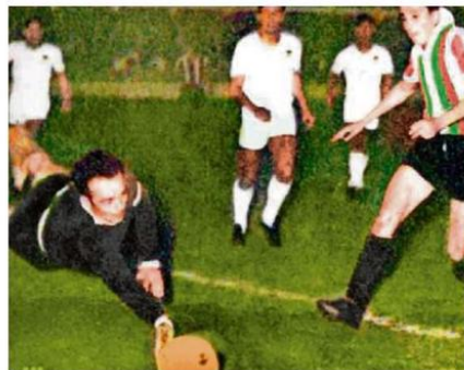
EL ENCUENTRO CORRESPONDió AL CAMPEONATO 1965-1966.