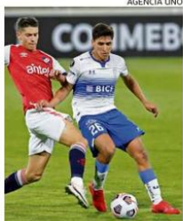
CRUZADOS ESTÁN SEGUNDOS.

COPA LIBERTADORES. El campeón chileno aspira a asegurar su avance.