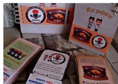
AGENDAS Y CALENDARIOS SON PARTE DE LA OFERTA.

realizo son con la idea de que cada cliente se lleve sus productos más personalizados, con su nombre, foto o caricatura. Ya llevo 8 meses en este rubro, espero seguir avanzando y seguir entregando nuestros productos a una clientela que cada día crece más y que ayuda a expandir este pequeño emprendimiento”.