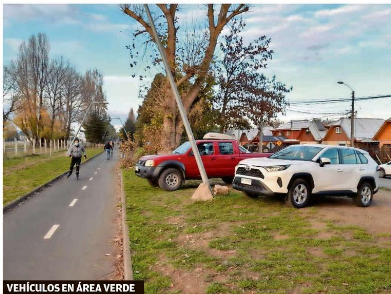
VEHÍCULOS EN ÁREA VERDE

Decenas de vehículos se estacionan a diario sobre el área verde, a un costado de la ciclovia a Labranza, en el sector de Altos del Maipo.