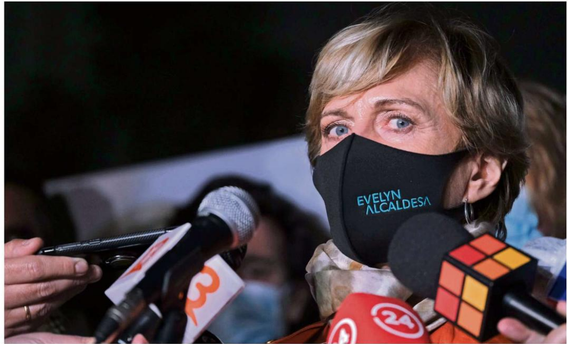
MATTHEI FUE LA PRIMERA CANDIDATA A LA MONEDA QUE DECIDIÓ RETIRAR SU POSTULACIÓN LUEGO DEL ESTREPITOSO FRACASO EN LA MEGAELECCIÓN DEL FIN DE SEMANA.

"Es necesario convocar a gente nueva, que traspase barre-