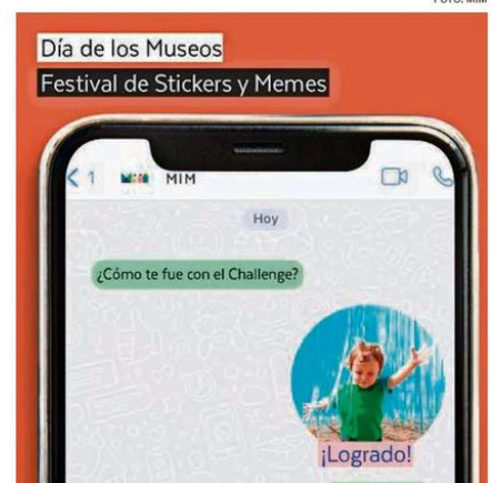
UN EJEMPLO DE LOS STICKER “CINETÍFICOS” QUE EL MUSEO INTERACTIVO MIRADOR PONE A DISPOSICIÓN.