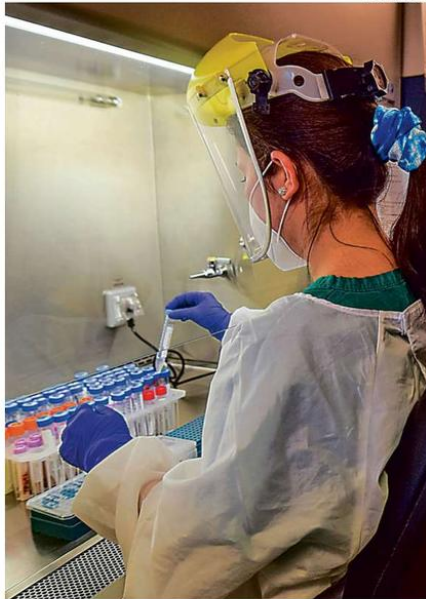
MÁS DE 3 MIL MUESTRAS FUERON PROCESADAS EN LAS ÚLTIMAS 24 HORAS.

REPORTERÍA. Solo Los Sauces retrocede a Cuarentena.