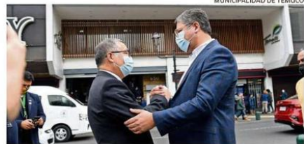
ROBERTO NEIRA SOSTUVO UN ENCUENTRO CON EL ALCALDE JAIME SALINAS.

creemos que vamos a recibir una municipalidad de la mejor forma, para poder trabajar tranquilos y solucionar las problemáticas", valoró Roberto Neira, quien fue elegido alcalde de Temuco con un total de 30 mil 313 votos.