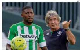
FALTA UNA FECHA PARA EL FIN DEL TORNEO.

● Manuel Pellegrini se llenó de elogios en la prensa española tras asegurar la participación de Real Betis a Copas de Europa para la próxima temporada. Estadio Deportivo resaltó que el DT nacional ya "se hace un hueco en la historia del Betis". Diario Marca comentó: "El principal responsable de este regreso a Europa del Betis es su técnico".