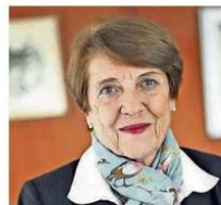
Consuelo Valdés, ministra de las Culturas