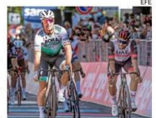
EL SPRINT FINAL.

● El eslovaco Peter Sagan (Bora Hansgrohe) se llevó la victoria en la décima etapa del Giro de Italia, disputada ayer entre L'Aquila y Foligno. El triple campeón mundial se quedó con el sprint en el que superó al colombiano Fernando Gaviria (UAE Emirates). La clasificación general sigue liderada por otro colombiano: Egan Bernal (Ineos).