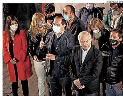
LA OPOSICIÓN NO DEFINE AÚN CÓMO CONTINUARÁ.

Esto llevó a que la propia candidata presidencial de la co-