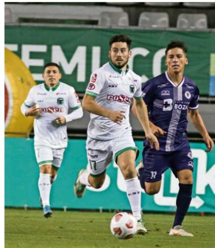
EL ALBIVERDE QUIERE SACARSE DE ENCIMA LA DERROTA COMO LOCAL ANTE SANTACRUZ.

en la zona afectada”, señaló Cisterna en los momentos previos a la salida de Temuco rumbo a Arica. “Tengo terapia dos veces al día para así potenciar el trabajo de recuperación”, agregó el extremo derecho al-