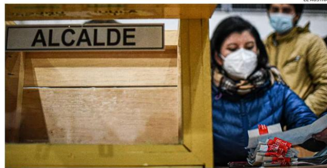
LAS MUJERES SIGUEN SUBREPRESENTADAS EN LAS COMUNAS DE LA ARAUCANÍA.