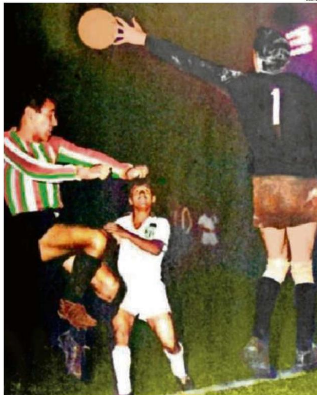
EL GREEN CROSS VENCió AL LOCAL PALESTINO EN UN PARTIDO MUY DISPUTADO.

La apertura del marcador hizo despertar al cuadro árabe, que se acordó que era local en el césped capitalino. Ese impulso que adquirió con el correr de los minutos le llevó a tomar más protagonismo y a darle trabajo al sólido arquero Francisco Fernández. El portero respondió con su habitual consistencia, pero no pudo hacer mucho ante el remate de Roberto Coll, que emparejó la cuenta en los