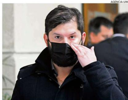
GABRIEL BORIC REUNIÓ FIRMAS PARA ESTAR EN PRIMARIAS.

ras ideológicas, que represente a la clase media", dijo Matthei.