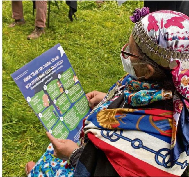
EN EL SECTOR PIEDRA ALTA DE LA COMUNA DE SAAVEDRA SE REALIZÓ ESTE ENCUENTRO.

"Lo que buscamos, además, es que esta información les haga sentido a los líderes de las comunidades mapuches y rurales para que la puedan transmitir a sus cercanos", precisó la seremi de