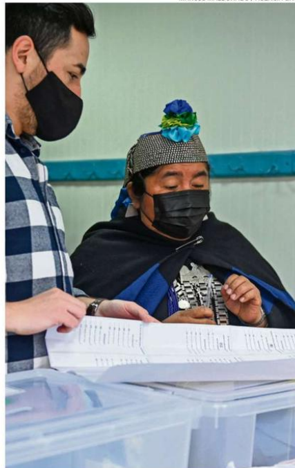
LA PARTICIPACIÓN MAPUCHE FUE RELEVANTE EL FIN DE SEMANA.