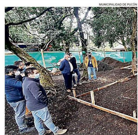
COMENZARON LAS OBRAS PARA LA CONSTRUCCIÓN DE ESTE NUEVO MUSEO DE LA PESCA EN PUCÓN.

conjunto con el Sindicato de Boteros, señalando que "quisimos generar este proyecto para recordar y destacar la gran labor realizada por nuestro boteros en los años 30, 40 y 50 como forjadores del turismo en nuestra comuna, lo que hoy ya es una realidad para nuestros amigos y vecinos".