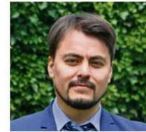
Enzo Cortesi, seremi de las Culturas

“Este reconocimiento destaca la excelencia de artesanías a nivel nacional, de acuerdo a los parámetros de Unesco”.