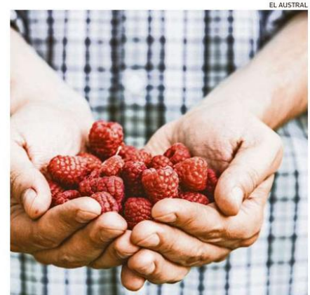
EL PLAZO SE EXTIENDE HASTA EL PRÓXIMO 31 DE MAYO.

El Catastro de Potencial Frutícola es el primer paso para reconocer los predios que tienen potencial para diversificar a este rubro y participar del Programa Araucanía Frutícola.