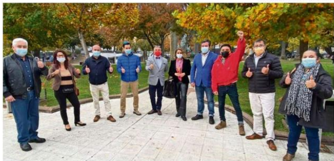
EL CONCEJO QUEDÓ INTEGRADO POR SIETE HOMBRES Y TRES MUJERES.