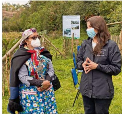
IMPORTANTES ESPACIOS INFORMATIVOS SON LOS QUE SE GENERAN.